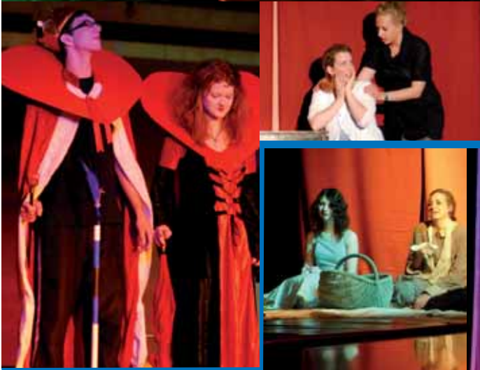
Es war einmal S4 FMü