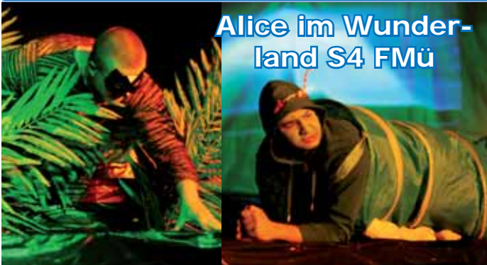
Alice im Wunderland S4 FMü