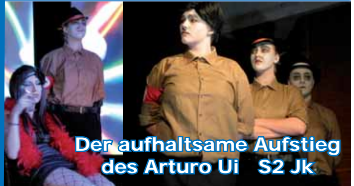
Der aufhaltsame Aufstieg des Arturo Ui S2 Jk